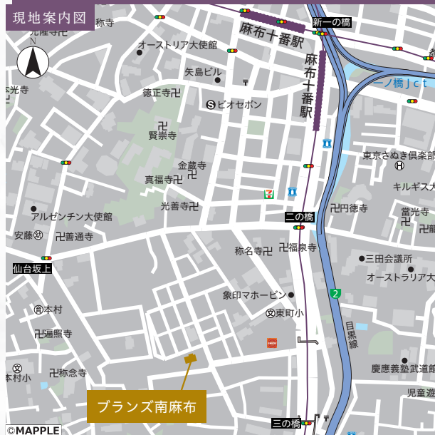
住居表示: 東京都港区南麻布1丁目27-13